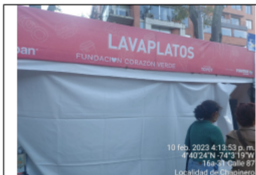
Fotografía 13. Lavaplatos.