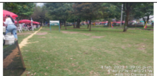
Fotografía 8. Ronda Hidrica