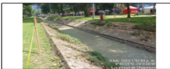
Fotografía 9. Canal El Virrey