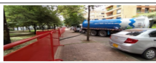
Fotografía 10. Unidad gestión externa de ARD