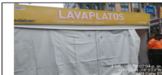
Fotografía 3. Lavaplatos