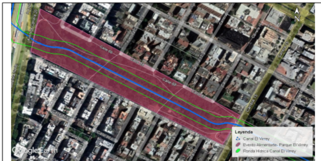
Imagen 1. Ubicación geográfica evento Alimentarte Food Festival – Parque El Virrey.

El evento ocupó las áreas comprendidas entre la Autopista Norte y la carrera 15.