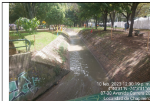
Fotografía 11. Canal El Virrey.

El descrito evento de descarga de aguas residuales al suelo cuenta con evidencia de ocurrencia para los días 11 y 12 de febrero de 2023.