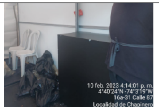
Fotografía 14. Interior de lavaplatos.