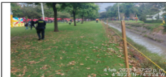
Fotografía 7. Ronda Hidrica.