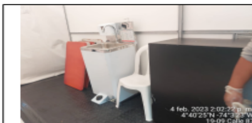
Fotografía 5. Lavaplatos.