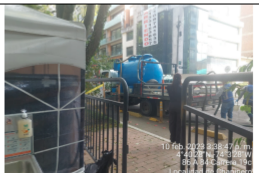
Fotografía 12. Vehículo de vacío usado para la limpieza de unidades sanitarias.