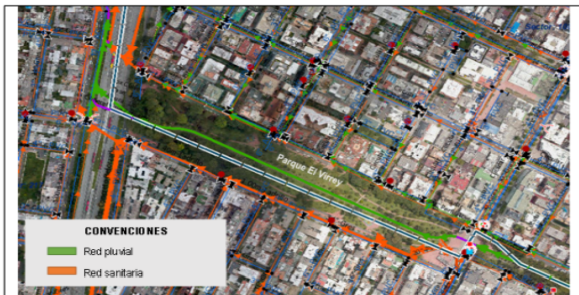
Imagen 2. Redes de Alcantarillado Pluvial y Sanitario en la zona del evento.

El evento Alimentarte se llevó a cabo en 2 jornadas, comprendidas la primera entre el 4 y 5 de febrero, y la segunda entre el 10 y 12 de febrero de 2023. A continuación, se describe el desarrollo de cada jornada de acompañamiento realizado por la SRHS.