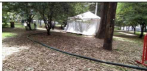
Fotografía 4. Conducción de ARD