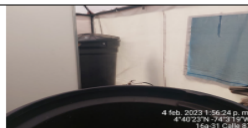
Fotografía 6. Almacenamiento ARD lavaplatos.